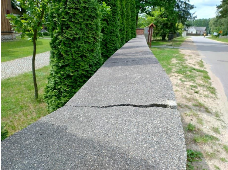
pęknięcia w płycie wierzchniej