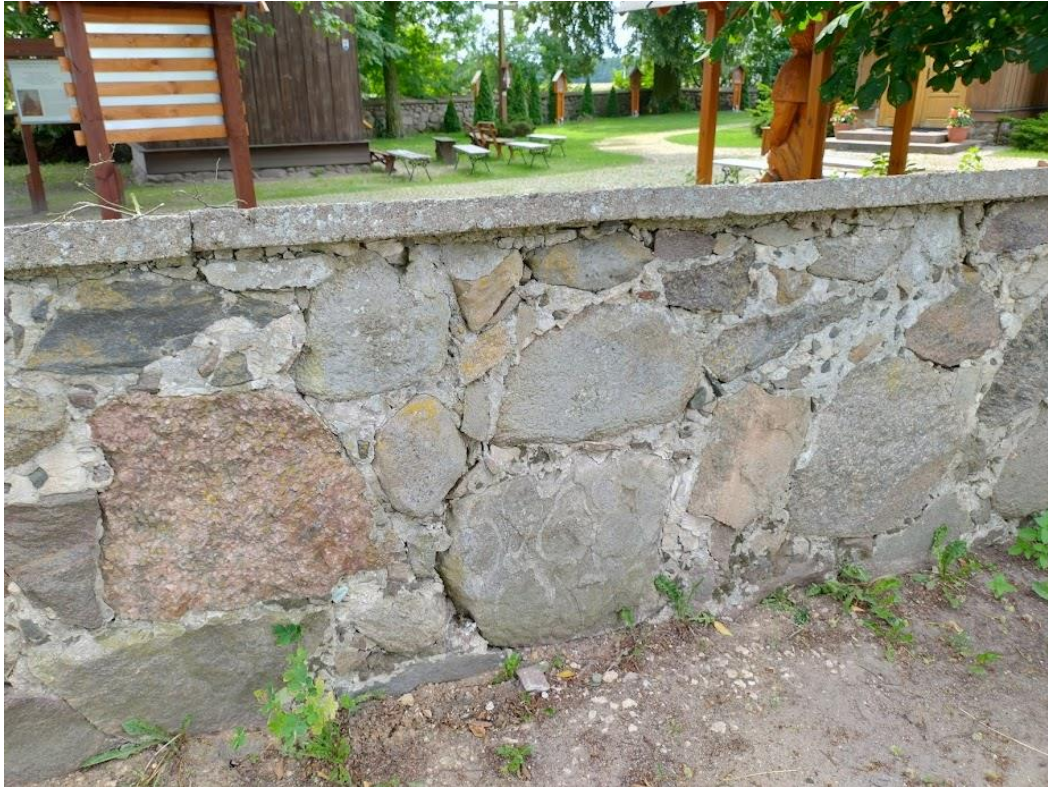
Postępujące erozja spoin