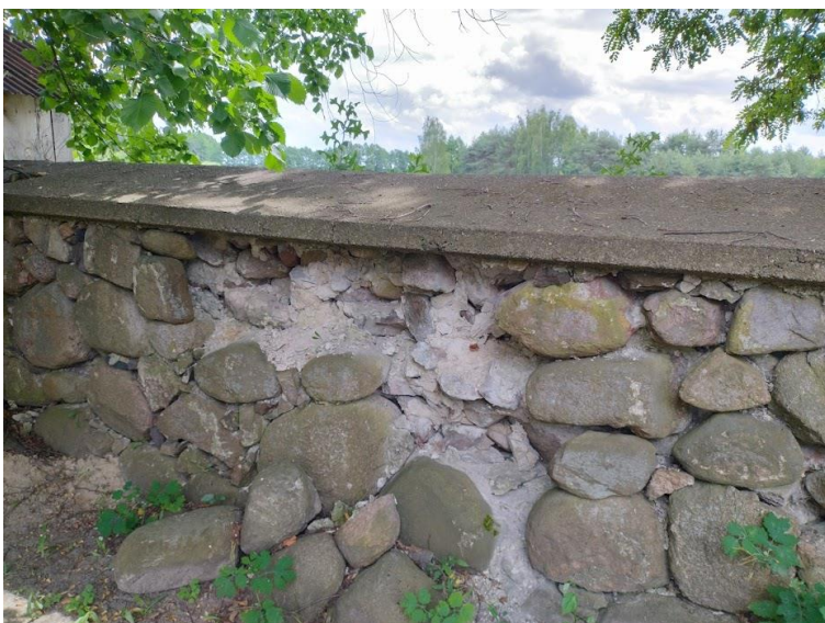
Degradacja spoin, ubytki, zanieczyszczenia